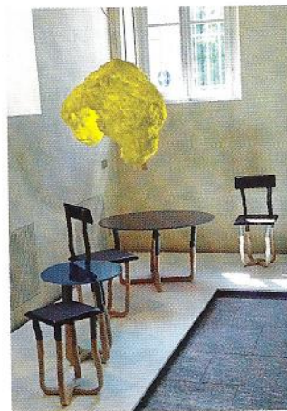
Vue de l'espace d'exposition de l'association Ca' Laghetto au 11, Via Laghetto.