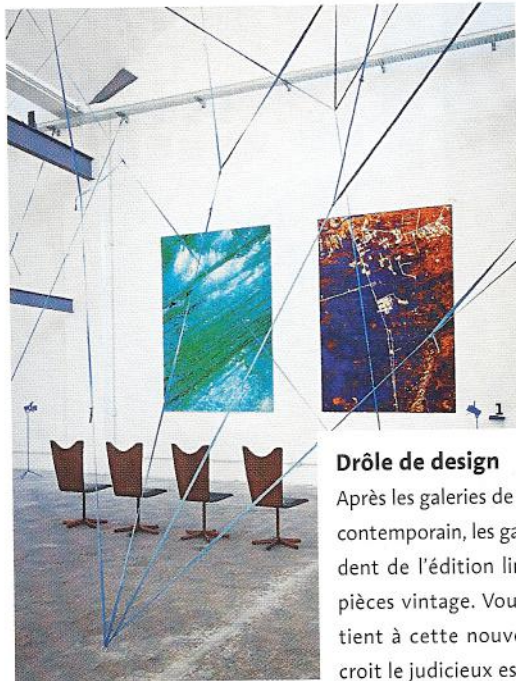
1/ et 3/ La galerie se déploie sur 1 500 m 2 , dans un local datant des années 1950.