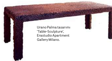
Urano Palma tasarımı 'Table-Sculpture', Erastudio Apartment Gallery Milano.