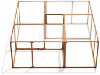
Rasmus Fenhann tasarımı 'Ratio', Galerie Maria Wettergren Paris.