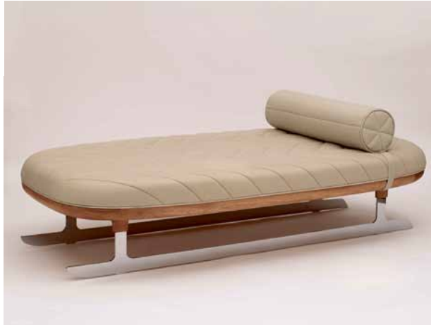
Jaime Hayon tasarımı 'Ice Skating Day Bed', Galerie Kreo Paris/Londra.