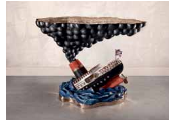
Studio Job tasarımı 'Sinking Ship', Chamber New York.