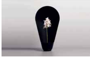
Ronan ve Erwan Bouroullec tasarımı 'Honda' vazo, Galerie Kreo Paris/Londra.